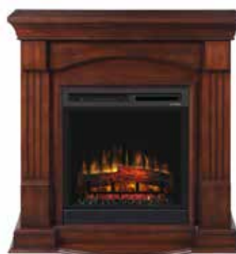
Campana XHD23 Optiflame®