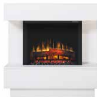
Avalone White Optiflame®